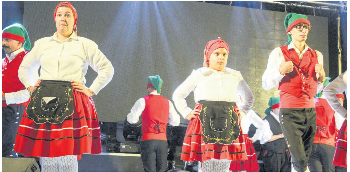
Festa em Honra de Nossa Senhora da Piedade decorre de 31 de Agosto a 3 de Setembro

dos locais mais apreciados pela população. Foi construído no século XIX, junto ao rio e às salinas, e é apreciado pela beleza natural. A importância do cais esteve sempre directamente relacionada com a actividade piscatória desenvolvida no Tejo sendo ainda hoje utilizado pelos pescadores avieiros. A bênção dos barcos avieiros no Tejo está agendada para dia 2 de Setembro à noite e é uma oportunidade de assistir a um dos momentos religiosos