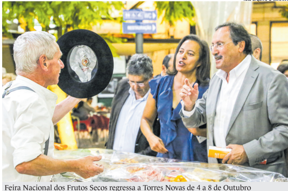
Feira Nacional dos Frutos Secos regressa a Torres Novas de 4 a 8 de Outubro

No recinto vão estar cerca de oito deze-