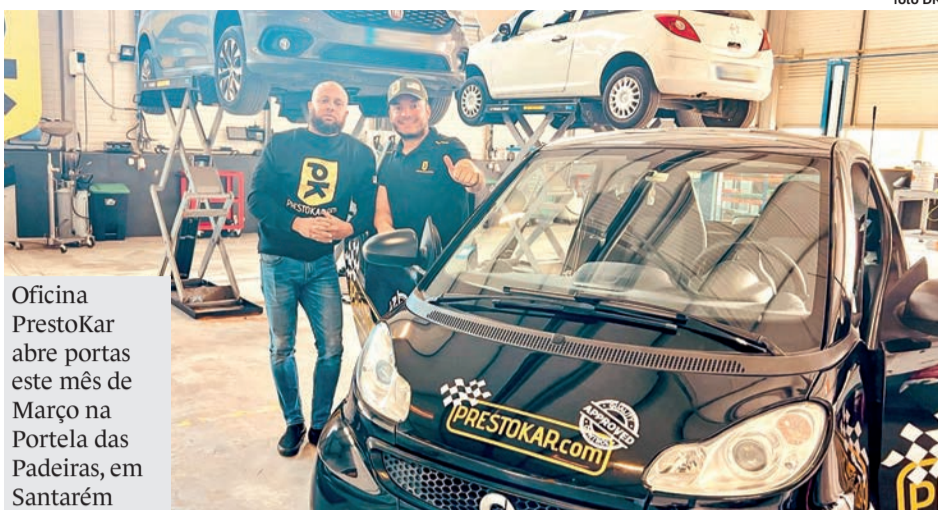
Oficina PrestoKar abre portas este mês de Março na Portela das Padeiras, em Santarém