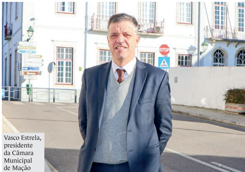
Vasco Estrela, presidente da Câmara Municipal de Mação

Dizemos muitas vezes que em Mação sentimos felicidade em estado puro quando, em férias, mas não só, é hora de dar um salto às nossas renovadas piscinas municipais descobertas, em Mação, ou às Piscinas de Envendos.