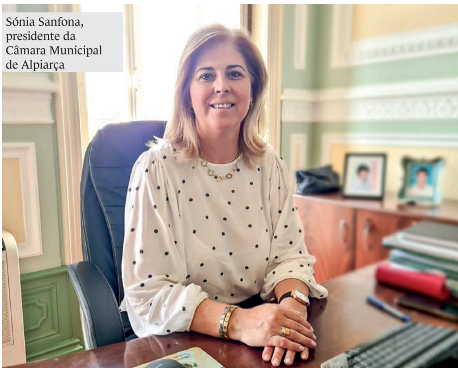
Sónia Sanfona, presidente da Câmara Municipal de Alpiarça

têm na Reserva Natural do Cavalo Sorraia um espaço privilegiado, dedicado a proporcionar momentos inesquecíveis, entre lugares de lazer e outros onde podem estar próximos de vários animais e interagir com eles, montar a cavalo, deliciar-se no restaurante da Reserva ou simplesmente usufruir do espaço verde ao ar livre.