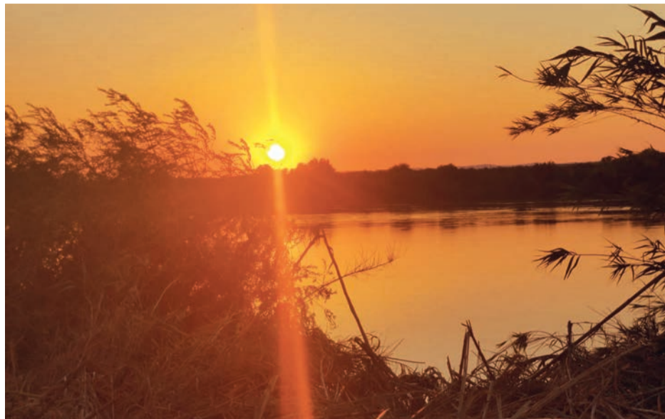
Região tem locais menos saturados de visitantes e não explorados pelo chamado turismo de massas.

São cada vez mais os roteiros temáticos históricos e culturais destinados a proporcionar experiências nessas áreas aos visitantes. Sucodem-se e consolidam-se experiências de artesanato e produção local, assim como festivais e eventos culturais que celebram as tradições locais, desde festas