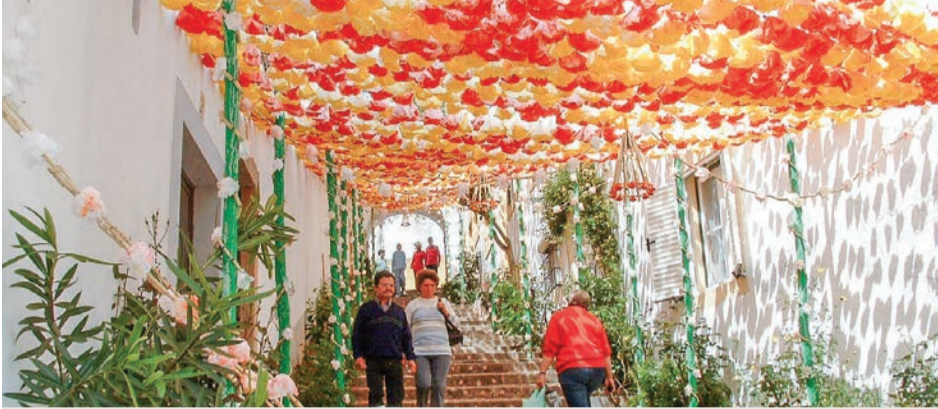
As ruas floridas são uma das imagens de marca das festas de Constância

O fim-de-semana de Páscoa é sinónimo de muita alegria e animação em Constância, com um programa que conjuga música, gastronomia e outras atracções com a componente religiosa ligada ao culto ancestral a Nossa Senhora da Boa Viagem. A bênção dos barcos evoca os tempos em que a vila foi um importante porto fluvial de transporte de mercadorias.