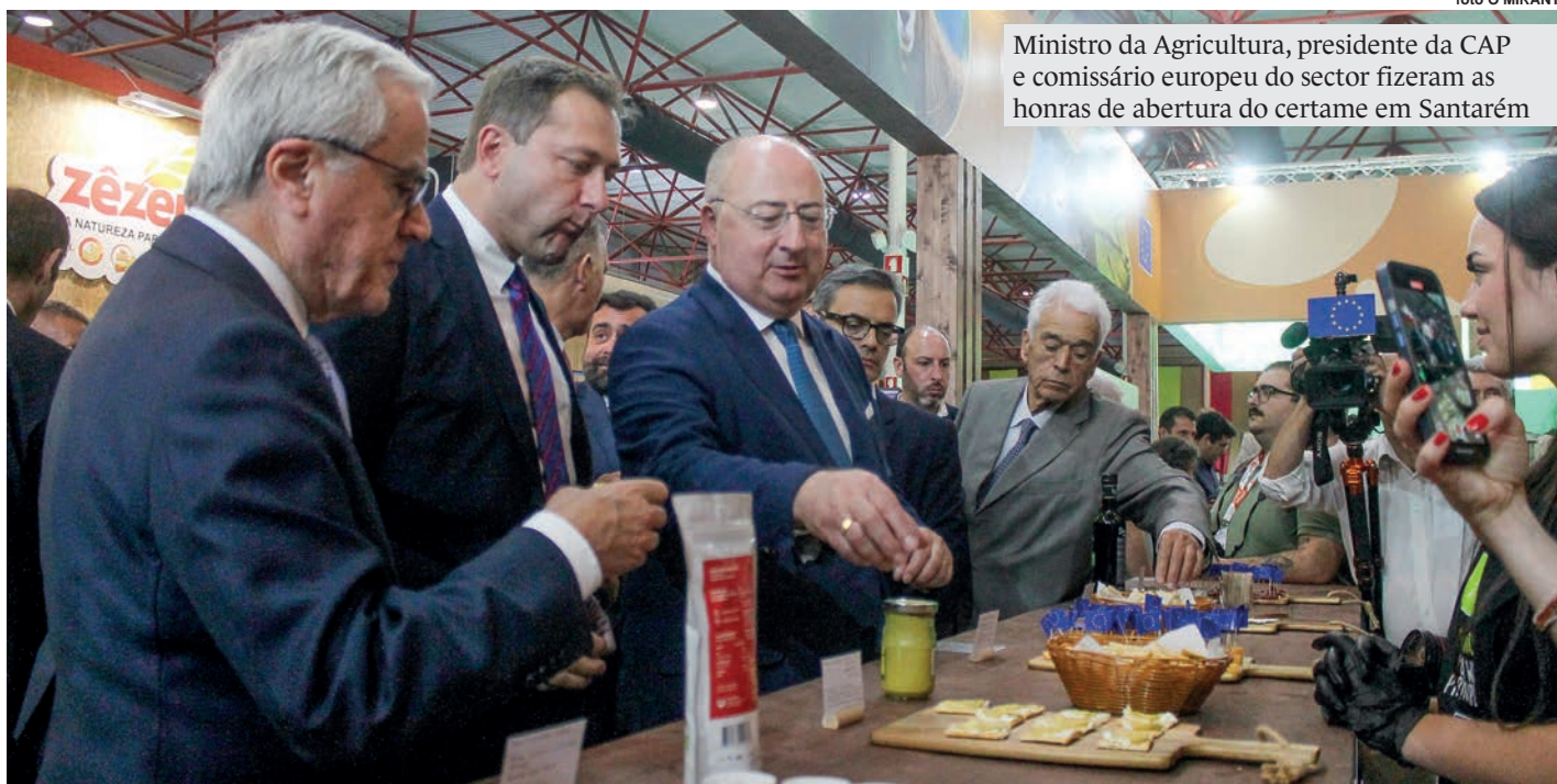
Ministro da Agricultura, presidente da CAP e comissário europeu do sector fizeram as honras de abertura do certame em Santarém

Ao contrário do que tem acontecido nos últimos anos, a Feira Nacional de Agricultura, em Santarém, não contou este ano com o Presidente da República na inauguração. O ministro da Agricultura e o comissário europeu do sector fizeram as honras de abertura, que não teve a agitação e colorido de anos anteriores.