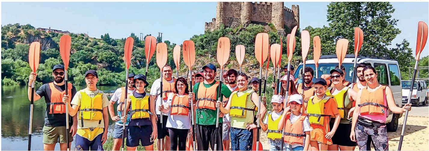
Empresa Módulo Intenso, de Ourém, promove actividades fora do trabalho como forma de motivar colaboradores

O conhecimento técnico, o rigor e o profissionalismo são os valores que movem a Módulo Intenso, que tem as suas