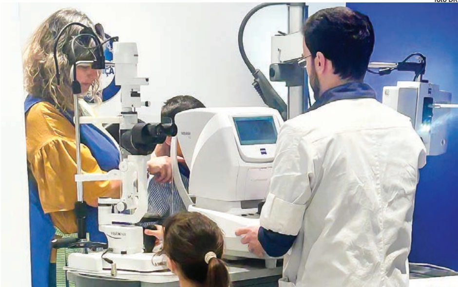
Crianças finalistas do Colégio Conde Sobral em Almeirim participaram em rastreio visual