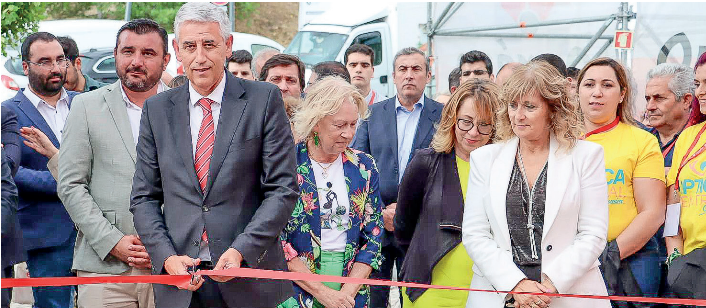
Edição de 2024 da FeirOurém foi um sucesso

FeirOurém vai decorrer em Ourém entre 18 e 22 de Junho. Não vão faltar espaços dedicados à gastronomia, aos automóveis e maquinaria agrícola, além de diversões para todas as idades. O cartaz musical conta com nomes como José Cid, Pedro Abrunhosa ou David Carreira.