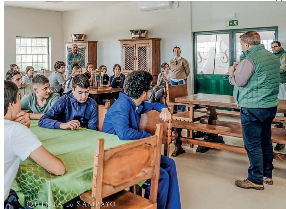
Quinta do Sompayo está a apostar numa transição para a agricultura regenerativa

Quinta do Sompayo, no Cartaxo, investiu mais dois milhões de euros na recuperação de infraestruturas, modernização de equipamentos e implementação de soluções ambientais.