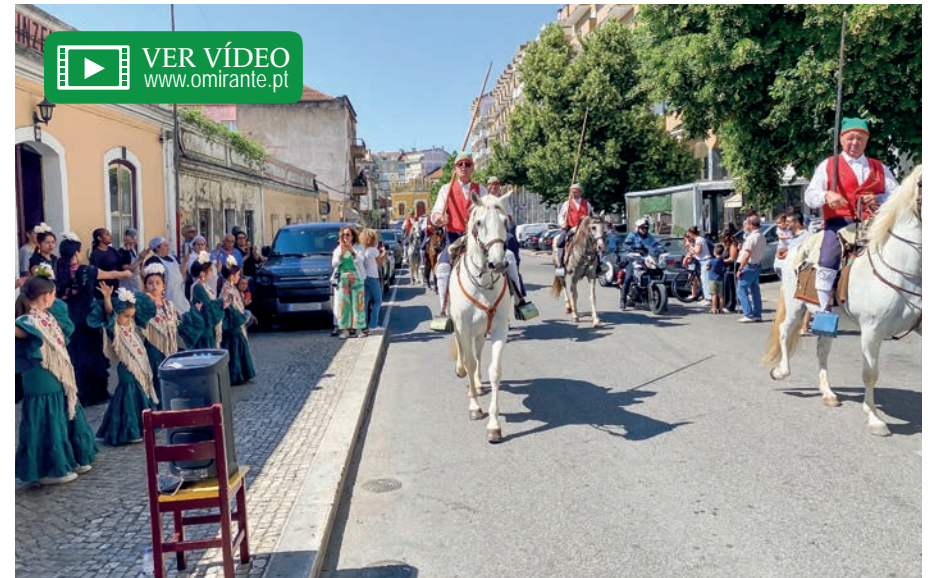
Desfile de campinos marcou mais um arranque da Feira Nacional de Agricultura

Santarém recebeu na manhã de sábado o tradicional desfile de campinos que assinalou o início de mais uma Feira Nacional de Agricultura/Feira do Ribatejo, a decorrer