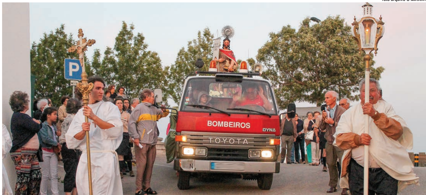
Procissão pelas ruas e no Tejo é um dos pontos altos das festas de Alhandra

A inauguração da festa está marcada para dia 19 de Junho, às 17h00, com animação pelo grupo de bombos "Os baionenses". Para sábado o programa começa pelas 11h00, com prova de full body no Clube Recreativo de Trancoso. Às 17h00 tem lugar um momento de dança com crianças da educação pré-escolar da Quinta da Ponte da Associação de Bem-Estar Infantil (ABEI) de Vila Franca de Xira. Por fim, no domingo, a partir das 17h00, haverá jogos tradicionais, também pela ABEI, na Quinta da Ponte. Às 18h00, a banda da Sociedade Euterpe Alhandrense realiza o seu já tradicional