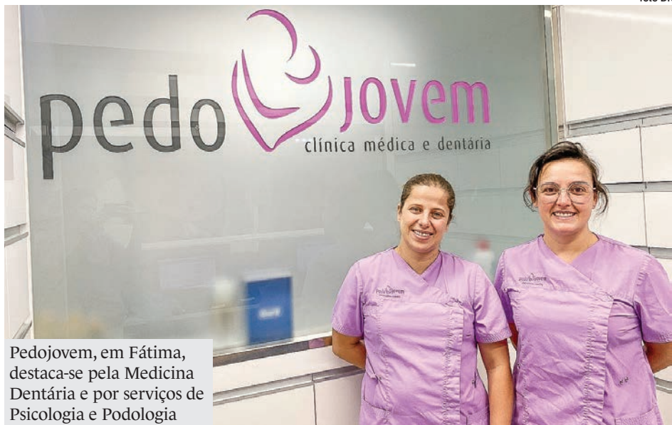
Pedojovem, em Fátima, destaca-se pela Medicina Dentária e por serviços de Psicologia e Podologia

A Pedojovem é uma clínica em Fátima com uma estrutura moderna e com profissionais altamente qualificados, que presta serviços de Medicina Dentária, Psicologia e Podologia, preocupando-se com o bem-estar dos utentes.