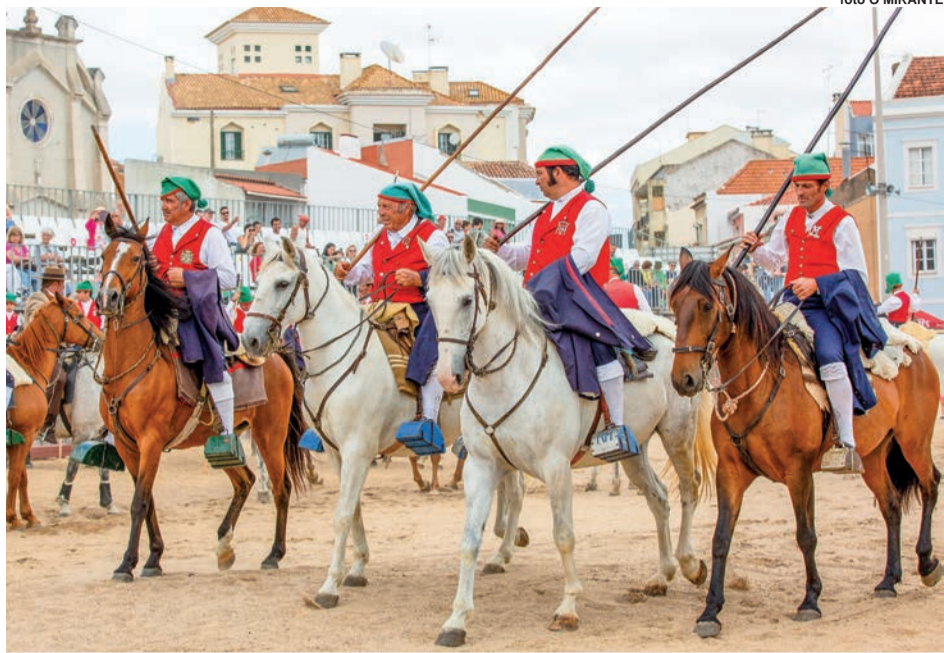
Homenagem ao campino com desfile pelas ruas da cidade na tarde de sábado continua a ser um dos pontos altos do Colete Encarnado