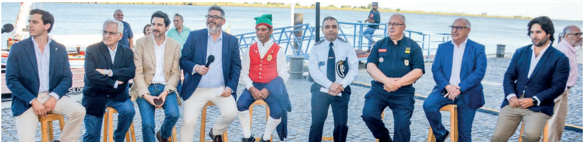
Colete Encarnado em Vila Franca de Xira mantém o caminho de crescimento e dinamização trilhado nos últimos anos, diz o presidente da câmara municipal

Vila Franca de Xira prepara-se para acolher a sua festa maior, o Colete Encarnado, de 4 a 6 de Julho. Tony Carreira, Nininho Vaz Maia e Gisela João vão ser os cabeças de cartaz mas o programa inclui eventos para todos os gostos. Este ano há a novidade dos passeios gratuitos de charrete e de barco.