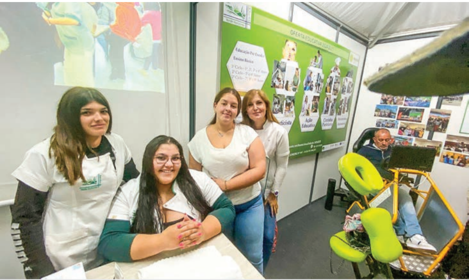
Alunos vão mostrar à comunidade alguns dos seus trabalhos na Feira Mostra de Mação

Alunos de Cozinha/Pastelaria, Mecatrónica Automóvel, Esteticista e Técnico Auxiliar de Saúde, do Agrupamento Verde Horizonte, vão marcar presença com demonstrações e dinamização de actividades. O Curso Profissional de Cozinha/Pastelaria do Agrupamento de Escolas Verde Horizonte, marcará presença na Feira Mostra de Mação, entre 2 e 6 de Julho, com uma demonstração de práticas inovadoras e apetecíveis, que prometem conquistar os visitantes com sabores únicos e apresentações criativas. Os alunos irão mostrar as suas compe-