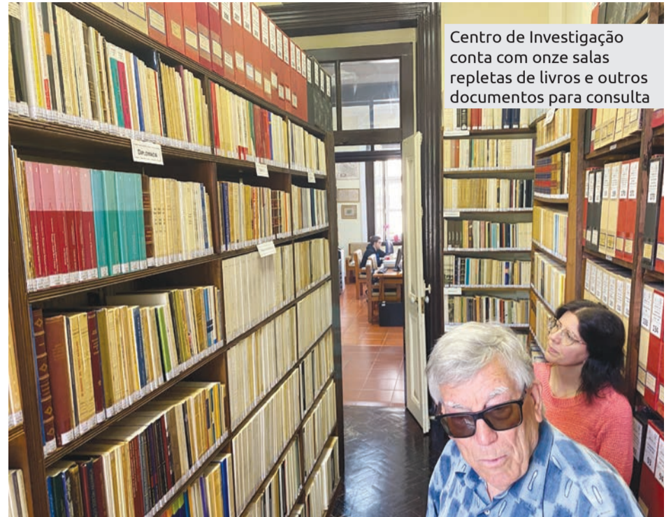
Centro de Investigação conta com onze salas repletas de livros e outros documentos para consulta

Mais de 30 mil livros e cerca de 300 caixas com documentos e correspondência foram legados pelo Historiador Joaquim Veríssimo Serrão à Câmara Municipal de Santarém