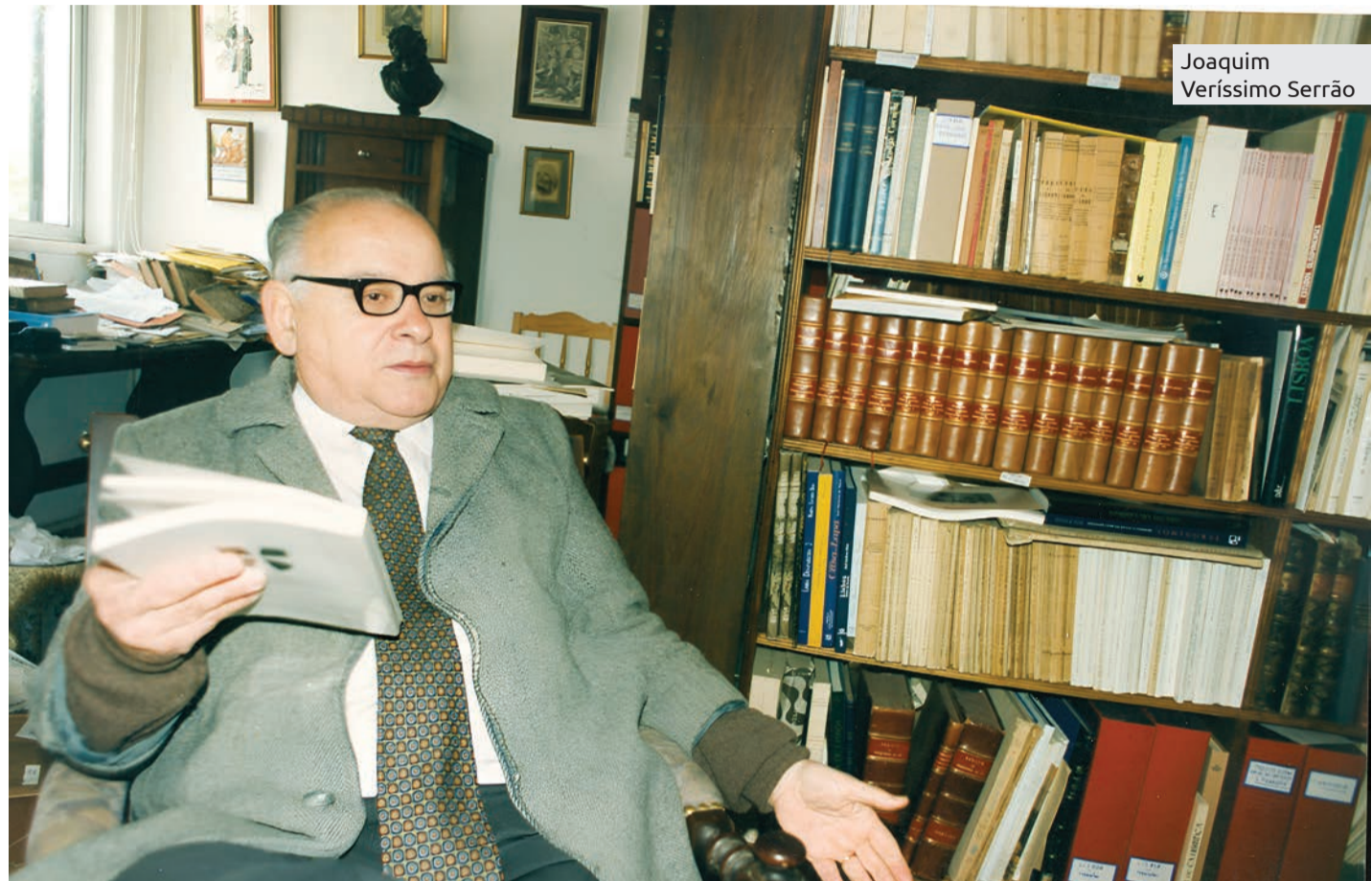
Joaquim Veríssimo Serrão