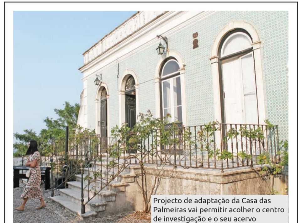
Projecto de adaptação da Casa das Palmeiras vai permitir acolher o centro de investigação e o seu acervo