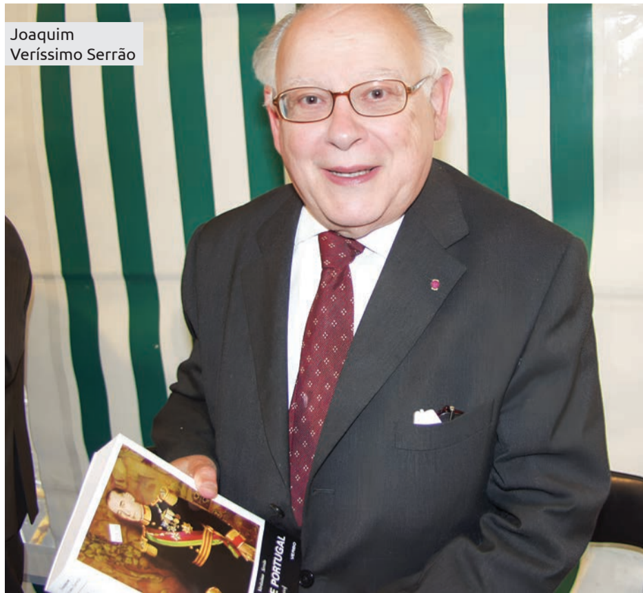
Joaquim Veríssimo Serrão

Talvez. Foram dadas às centenas e deixaram de me interessar. Mas tenho muita honra em ser português, e sou acima de tudo um