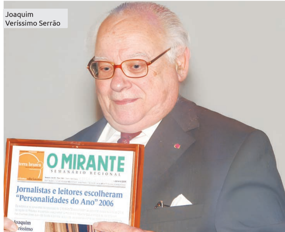
Joaquim Veríssimo Serrão

no fundo era uma história que não se compreendia mas, porque era pesada, todos achavam que era a suma potência do conhecimento do passado. De modo que Oliveira Martins foi uma das minhas paixões, mas as lindas imagens que ele tinha para caracterizar o passado nacional nem sempre eram justas. Chamar a Afonso Henriques, por exemplo, um poltrão, um bandido; chamar a D. Pedro I, gago; chamar a um outro rei, um impotente ou chamar a D. João V o rei freirático, quando ele teve uma aventura com uma freira, que foi a única freira que ele conheceu, como se ele fosse o Senhor de todas as freiras do país, são exageros que ele praticava naquele poder colossal que tinha de criar imagens. Depois da minha primeira estada em França, a partir dos anos de 50, passei a interessar-me pela nova História. Uma História integral, tanto quanto possível, que não é só política, económica nem social. É uma História que procura abarcar tudo aquilo que diz respeito ao homem na sua longa trajectória humana. E sim, Georges Lefebvre é um dos meus ídolos. Continua a sê-lo. Mas, para mim, o problema das influências não está apenas naquilo que os Historiadores escreveram, mas também na mensagem humana que eles deixam, porque há Historiadores de grande categoria, mas humanamente intragáveis, vaidosos, petulantes, convencidos que têm a verdade nas mãos, sem a noção da humildade que faz